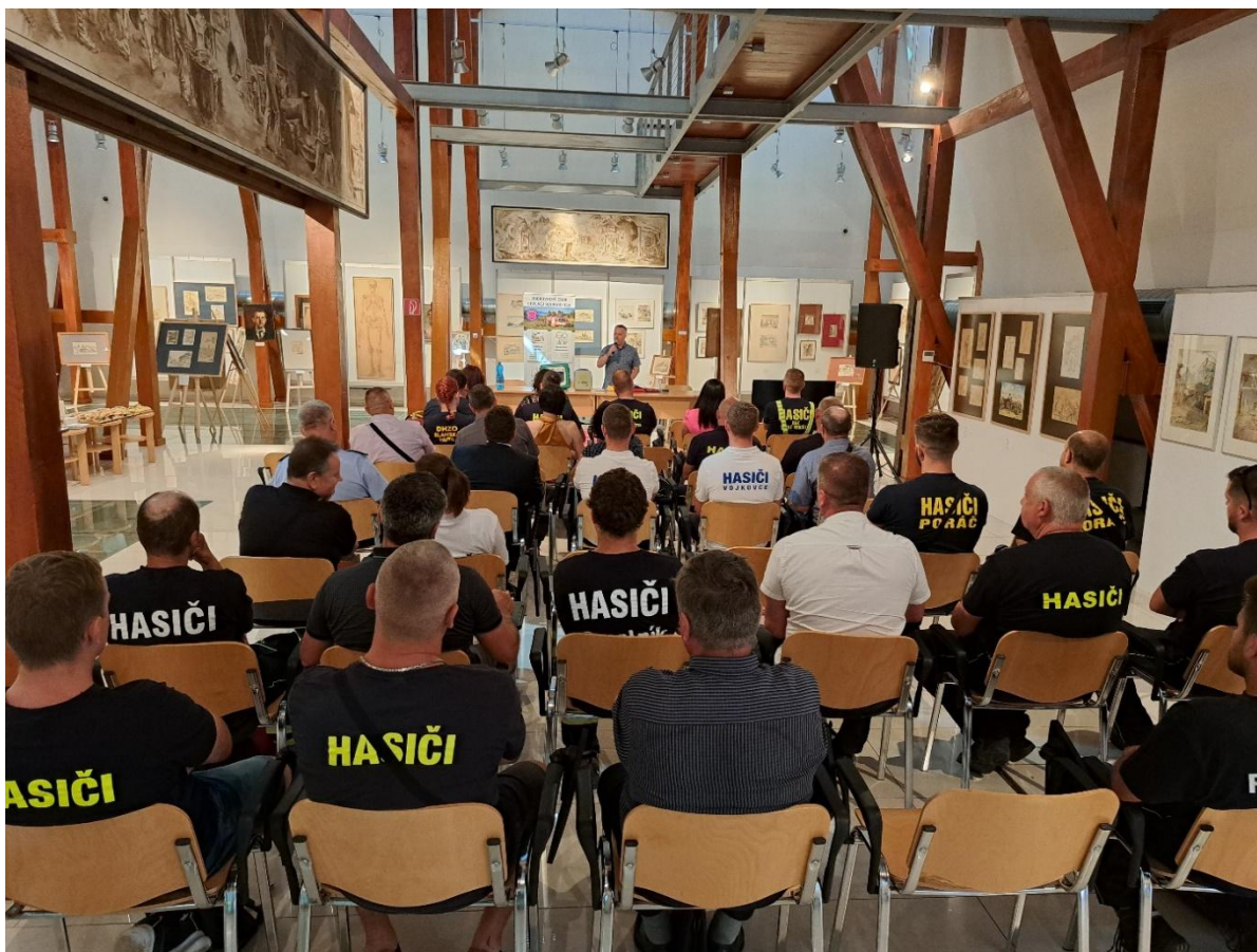
Obrázok 1. odovzdávanie AED