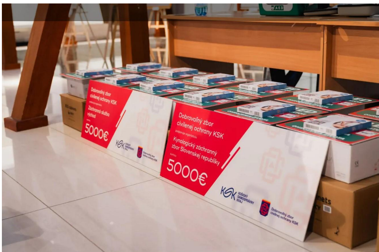
Obrázok 4. odovzdávanie príspevkov partnerským organizáciám