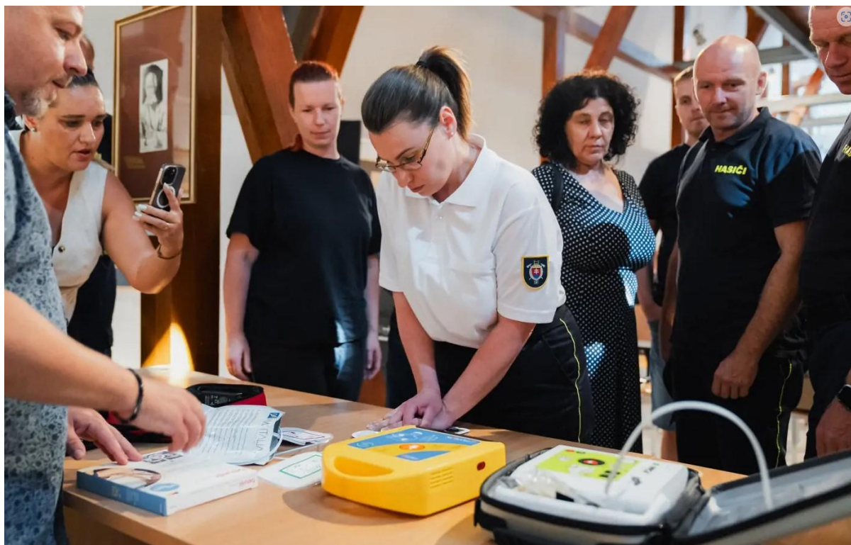
Obrázok 2. školenie používania AED