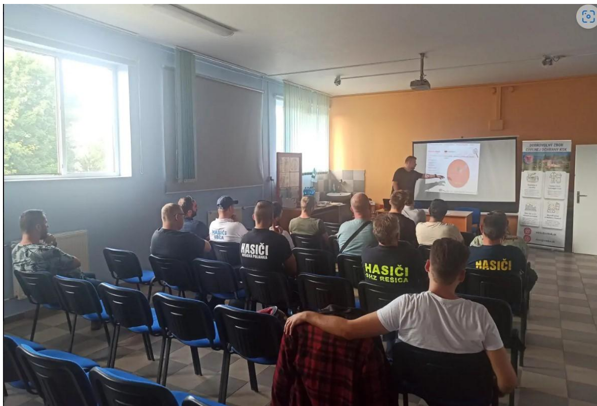
Obrázok 3. školenie odbornej spôsobilosti